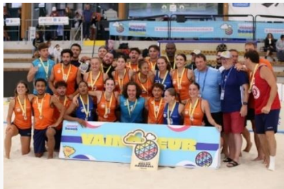
Double titre de Championnes et Champions de France en Beach Handball